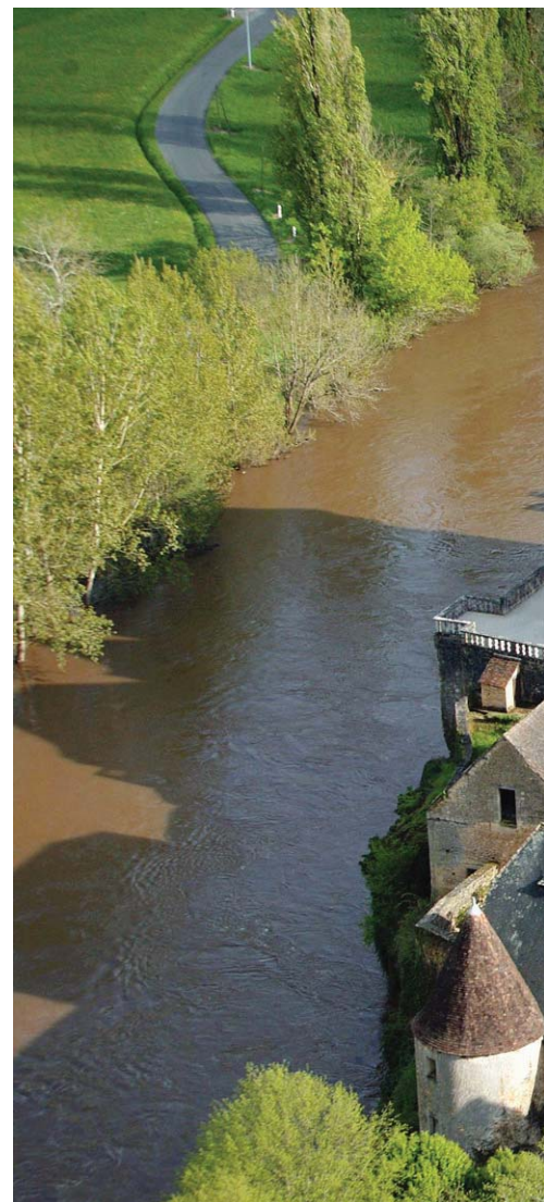
Les visites du château de Losse qui surplombent

Exposition au presbytère Saint-Jacques, place du Livre-de-Vie à Bergerac, jusqu'à dimanche, de 14 à 19 heures. Conférences samedi après-midi à partir de 15 heures. Entrée libre. Visites guidées du château de Garrigues, l'ancienne de-